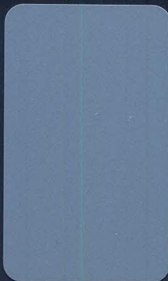
Anodic Sapphire AE20105000520