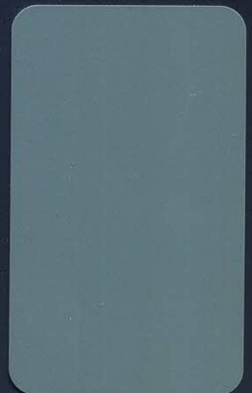
Anodic Malachite AE20106000620