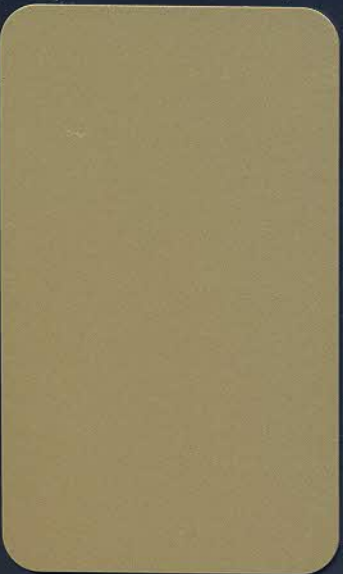
Anodic Gold AE20111000820