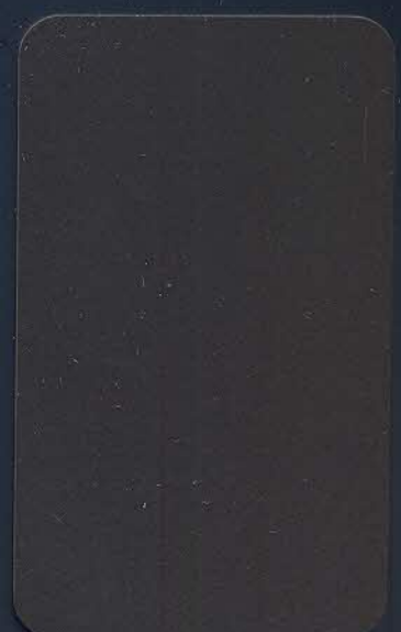
Anodic Brown AE20108000420