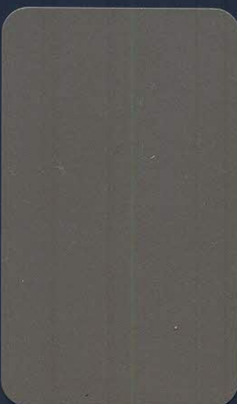
Anodic Bronze AE20108000320