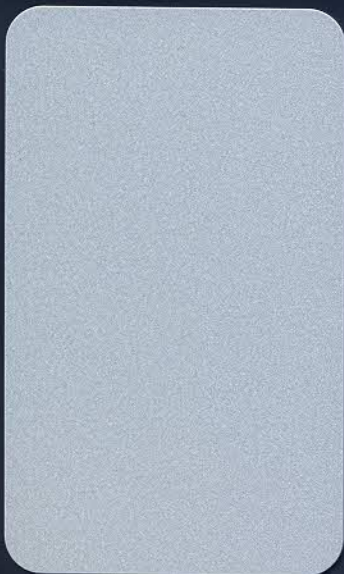
Anodic Natura AE20107000120