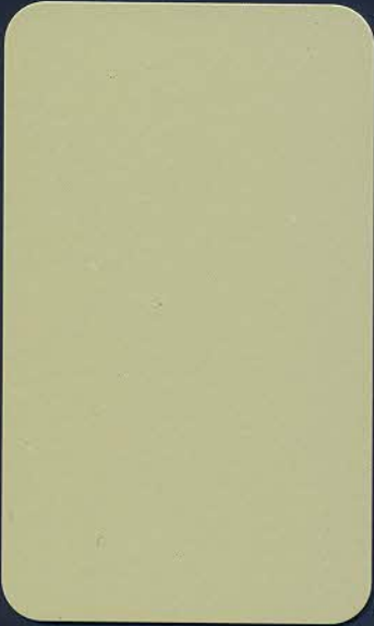
Anodic Champagne AE20101000220

TR Anodic Collection, popüler olan anodik tonlarını yakından takip eden bir renk serisidir ve standart eloksal kaplamanın etkisini sunar. Bu seri, toz boya ile ilgili tüm avantajlara sahiptir ve Alesta® AP kalitesinde mevcuttur. Dikkat çekici bu koleksiyon, seçtiğiniz anodik efekt renginde hızlı ve düşük maliyetli sonuç sağlar ve Qualicoat Class I ve GSB sertifikalarının her ikisine de sahiptir.